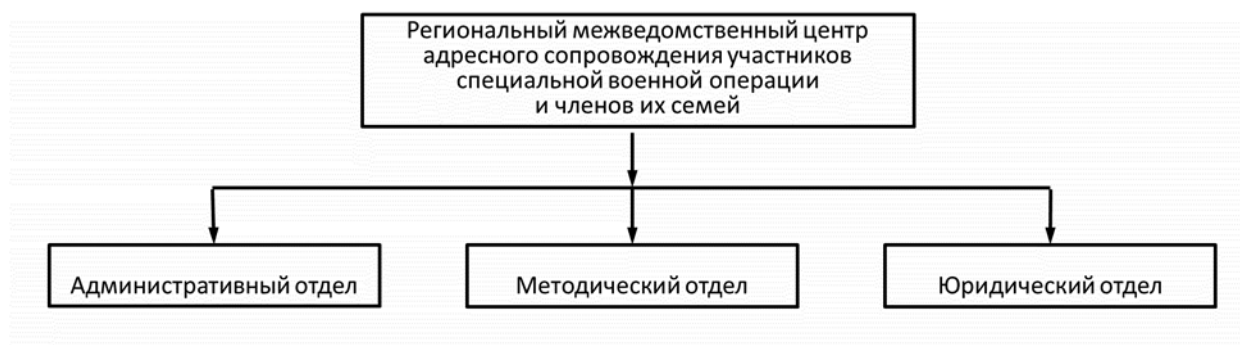
Рис. 2. Примерная структура Регионального межведомственного центра адресного сопровождения участников специальной военной операции и членов их семей