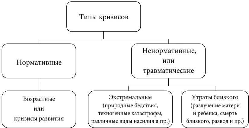
Рис. 1. Типы кризисов

Проблема существования определенных возрастных периодов в процессе развития личности поднималась в многочисленных исследованиях зарубежных авторов и рассматривались в разных аспектах. В первую очередь, это представления о смене некоей структуры или организованности: например, теория стадий развития сексуальности З. Фрейда, теория развития интеллекта Ж. Пиаже и другие.